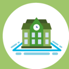
Numero studenti per indirizzo di studio e anno di corso